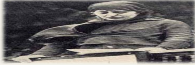
Sultanahmet mitinginde Halide Edip Adıvar'ın konuşma anı

noktası Halide Edip Adıvar olmakla birlikte kazanımlarla ilişkili olarak milli mücadele sürecinde yaşanan olaylar (Yunan ordusunun İzmir'i işgali, M. K. Atatürk'ün Samsun'a çıkışı, Anadolu Ajansı'nın kurulması, vb.) da biyografik akışı bozmayacak biçimde oluşturulmuştur. Şekil 1'de araştırmacılar tarafından hazırlanan biyografik metne ilişkin örnek bir bölüm yer almaktadır.