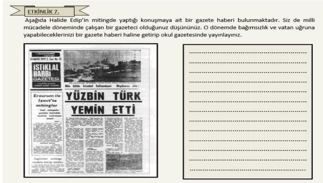
Şekil 2. Araştırmacılar Tarafından Hazırlanan Çalışma Sayfaları

öğrencilere dağıtılmıştır. Halide Edip Adıvar'ın biyografisine dayalı olarak çalışkanlık, vatanseverlik ve bağımsızlık değerlerini konu edinen çalışma sayfalarından örnek bir bölüm Şekil 2'de gösterilmiştir.